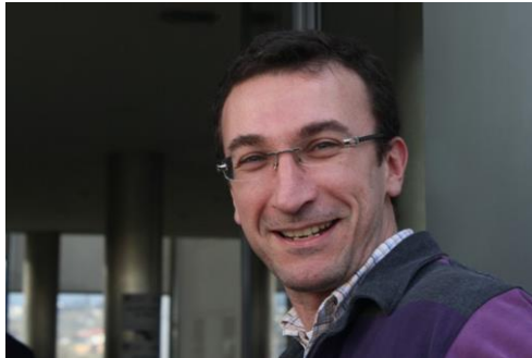
Foto oficial do responsável pelas Relações c/os concorrentes